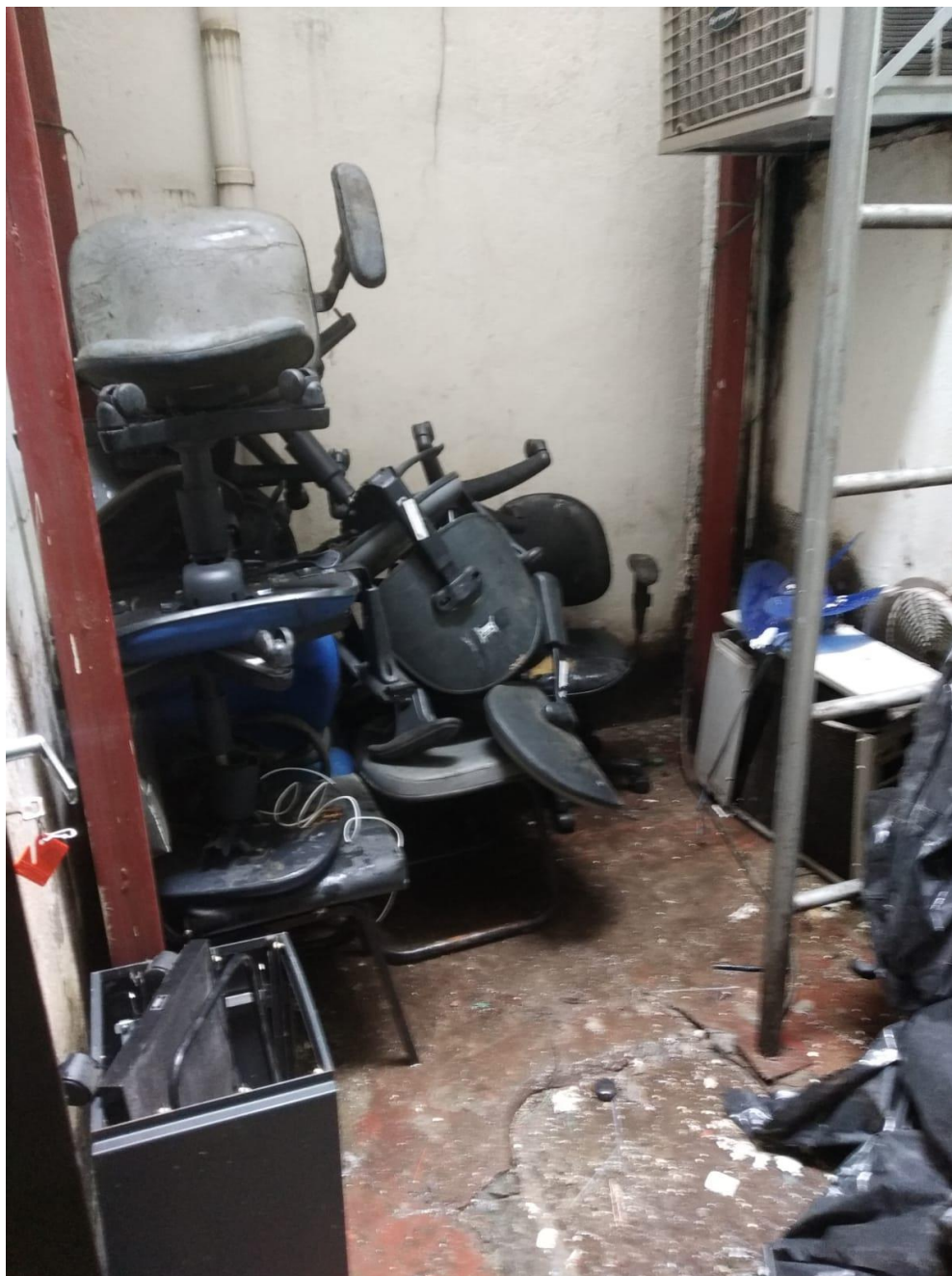
Foto 03 Cadeiras, carrinhos e Gaveteiros.