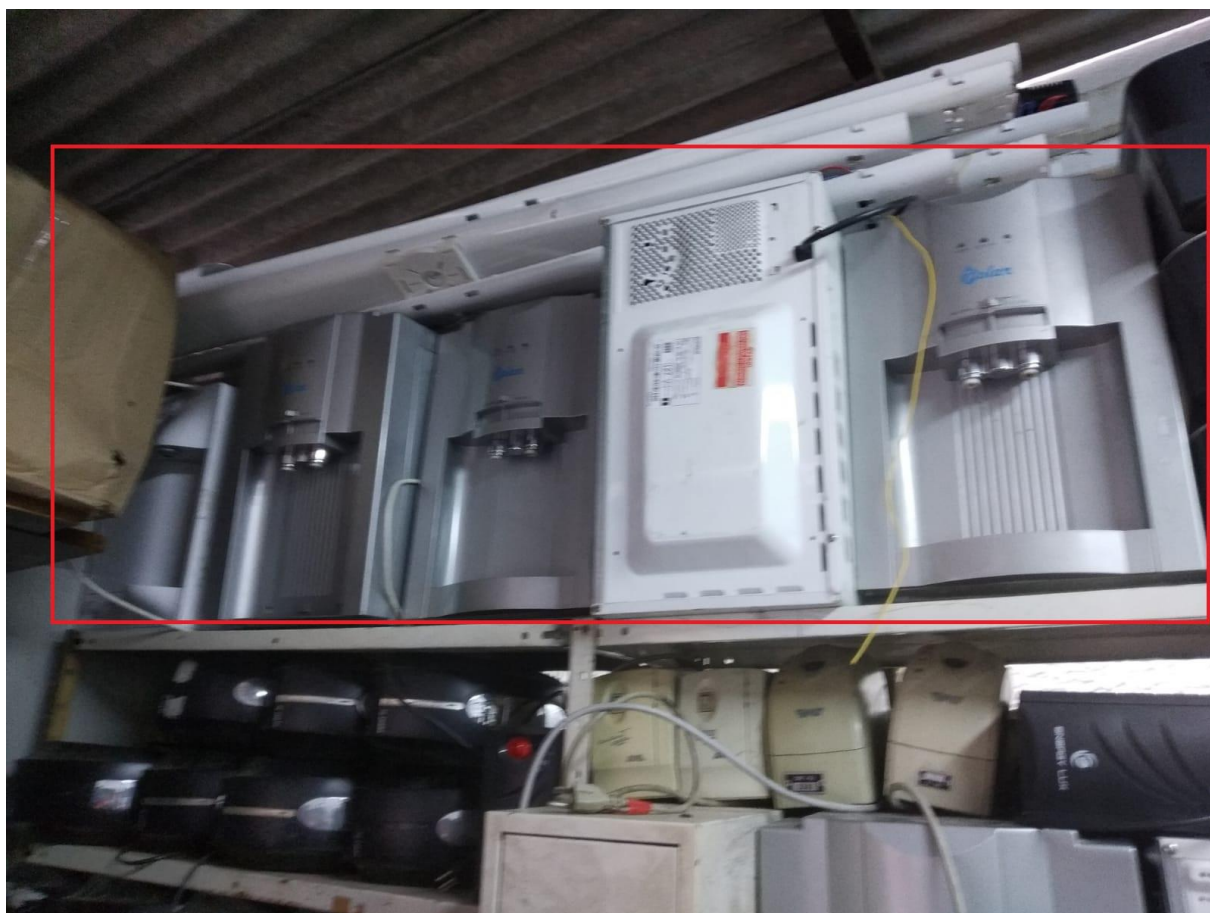
Foto 01 Filtros e Micro-ondas.